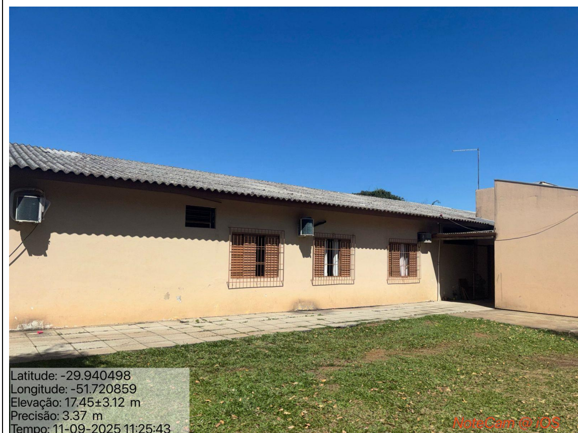
Legenda: Vistas das fachadas externas.