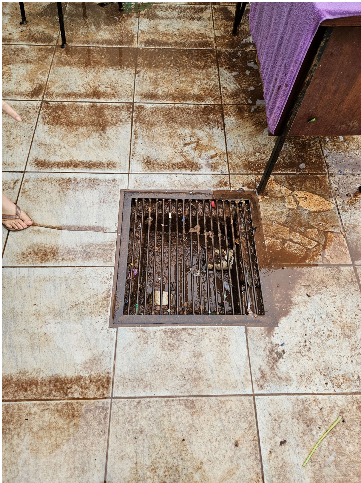
Figura 7: Caixa de inspeção e passagem pluvial congestionada por lama

PREFEITURA MUNICIPAL DE TRIUNFO SECRETARIA MUNICIPAL DE PLANEJAMENTO E URBANISMO Rua XV de Novembro, 30 – Triunfo – RS – CEP – 95.840-000 e-mail: planejamento@triunfo.rs.gov.br