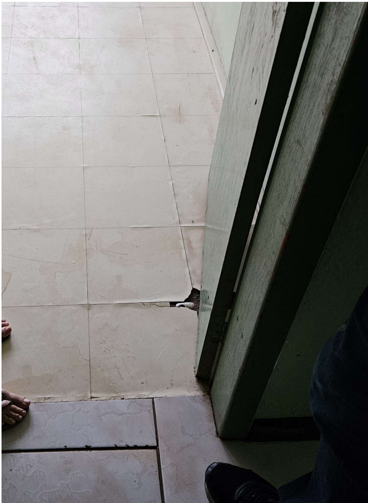
Figura 3: Piso vinílico com descolamentos e rasgos

PREFEITURA MUNICIPAL DE TRIUNFO SECRETARIA MUNICIPAL DE PLANEJAMENTO E URBANISMO Rua XV de Novembro, 30 – Triunfo – RS – CEP – 95.840-000 e-mail: planejamento@triunfo.rs.gov.br