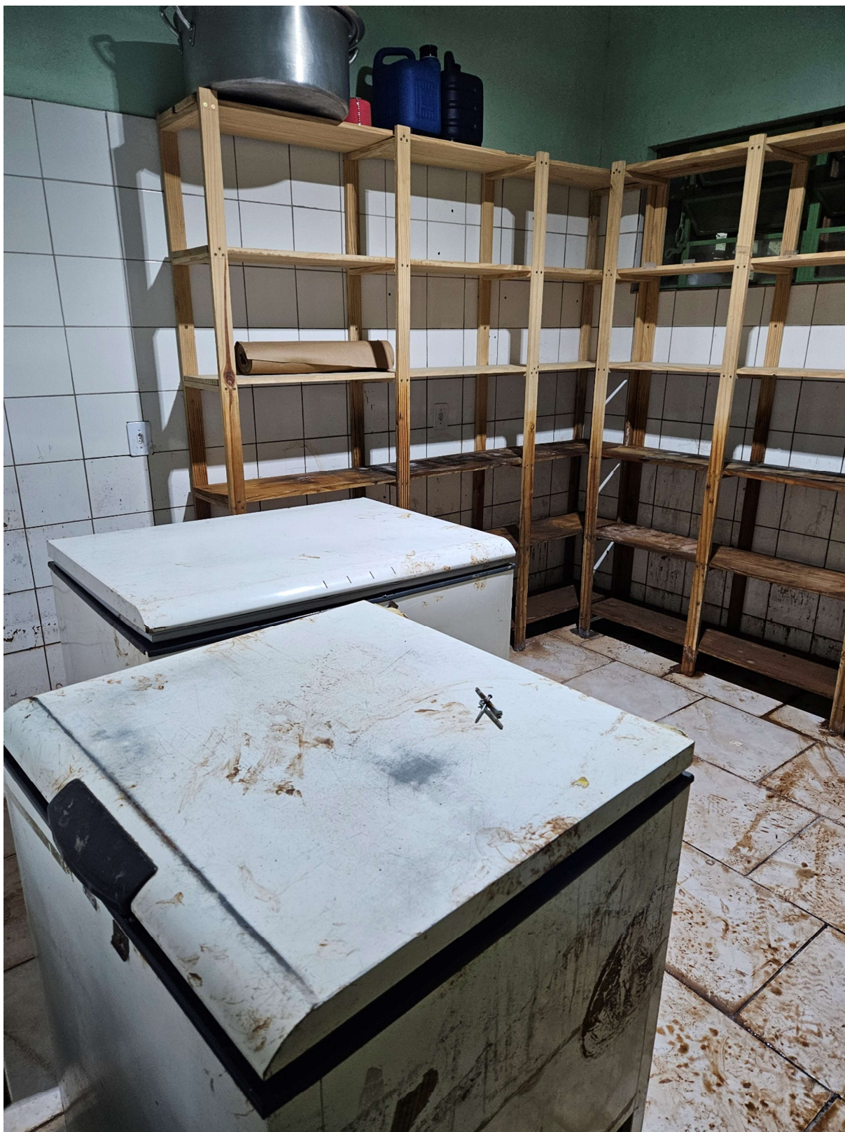
Figura 6: Dispensa com tomadas de média altura danificadas

PREFEITURA MUNICIPAL DE TRIUNFO SECRETARIA MUNICIPAL DE PLANEJAMENTO E URBANISMO Rua XV de Novembro, 30 – Triunfo – RS – CEP – 95.840-000 e-mail: planejamento@triunfo.rs.gov.br