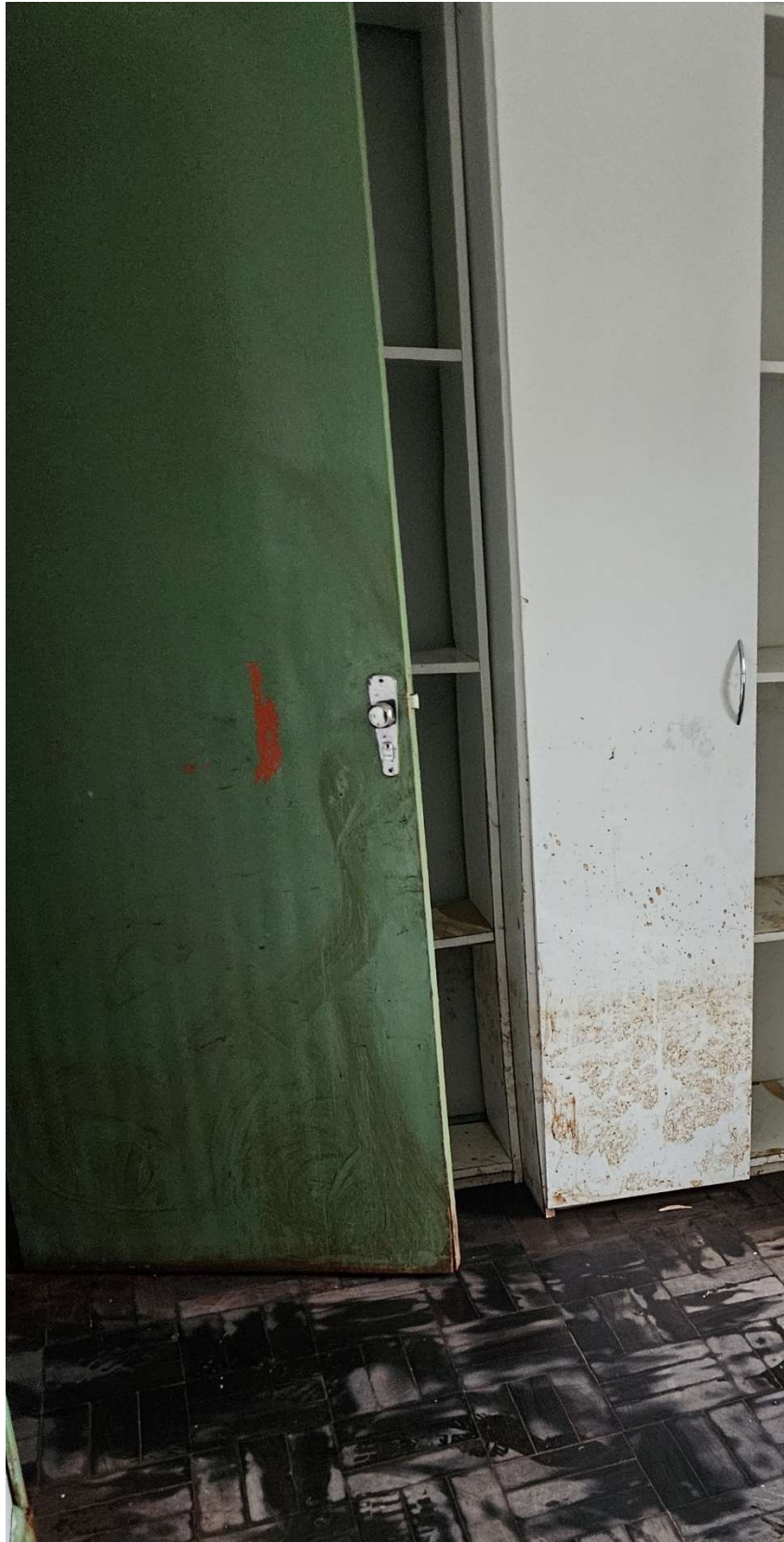
Figura 1: Porta interna de madeira estufada pela umidade

PREFEITURA MUNICIPAL DE TRIUNFO SECRETARIA MUNICIPAL DE PLANEJAMENTO E URBANISMO Rua XV de Novembro, 30 – Triunfo – RS – CEP – 95.840-000 e-mail: planejamento@triunfo.rs.gov.br