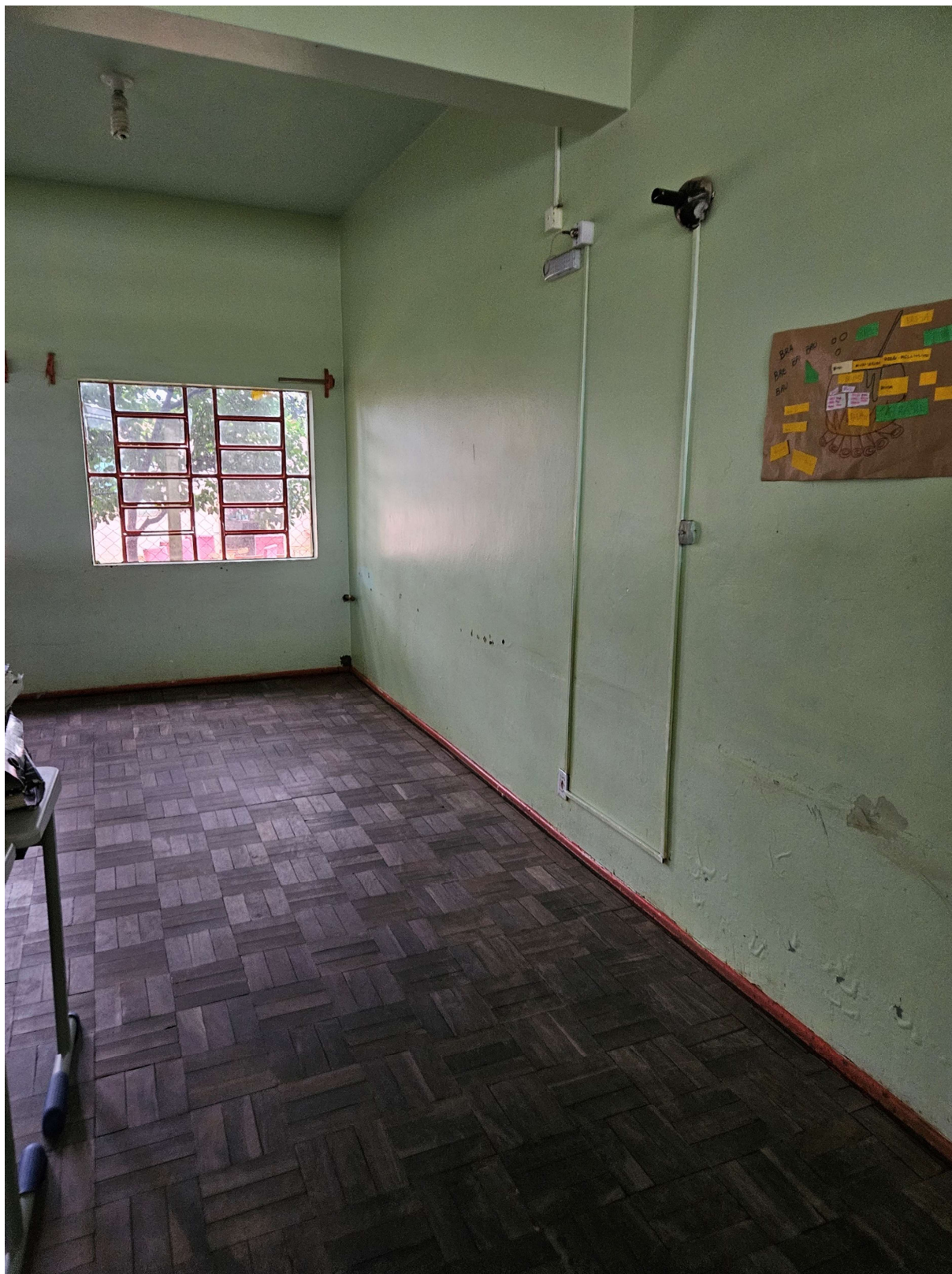
Figura 5: Piso de madeira com peças empenadas e desniveladas. Pintura da parede com bolhas e descascamentos

PREFEITURA MUNICIPAL DE TRIUNFO SECRETARIA MUNICIPAL DE PLANEJAMENTO E URBANISMO Rua XV de Novembro, 30 – Triunfo – RS – CEP – 95.840-000 e-mail: planejamento@triunfo.rs.gov.br