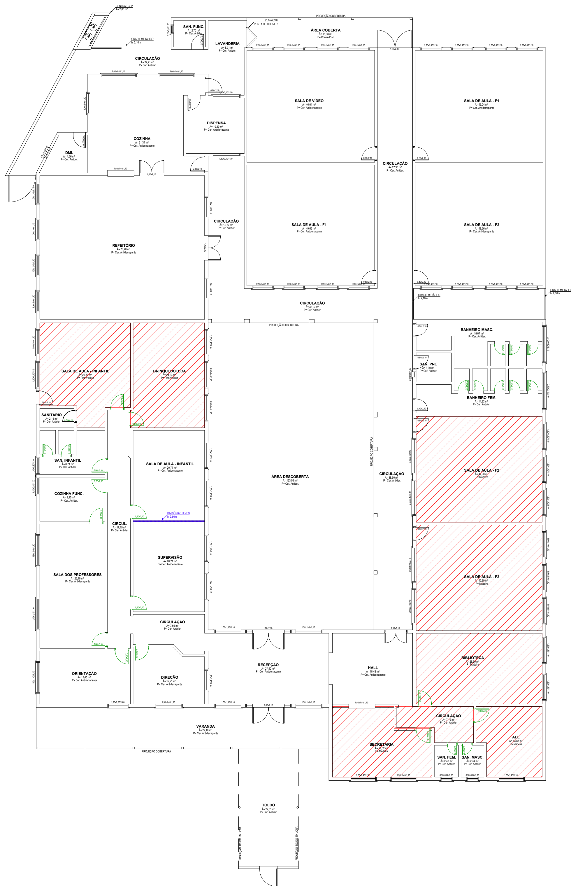
PLANTA DE DEMOLIÇÃO ESCALA 1:125