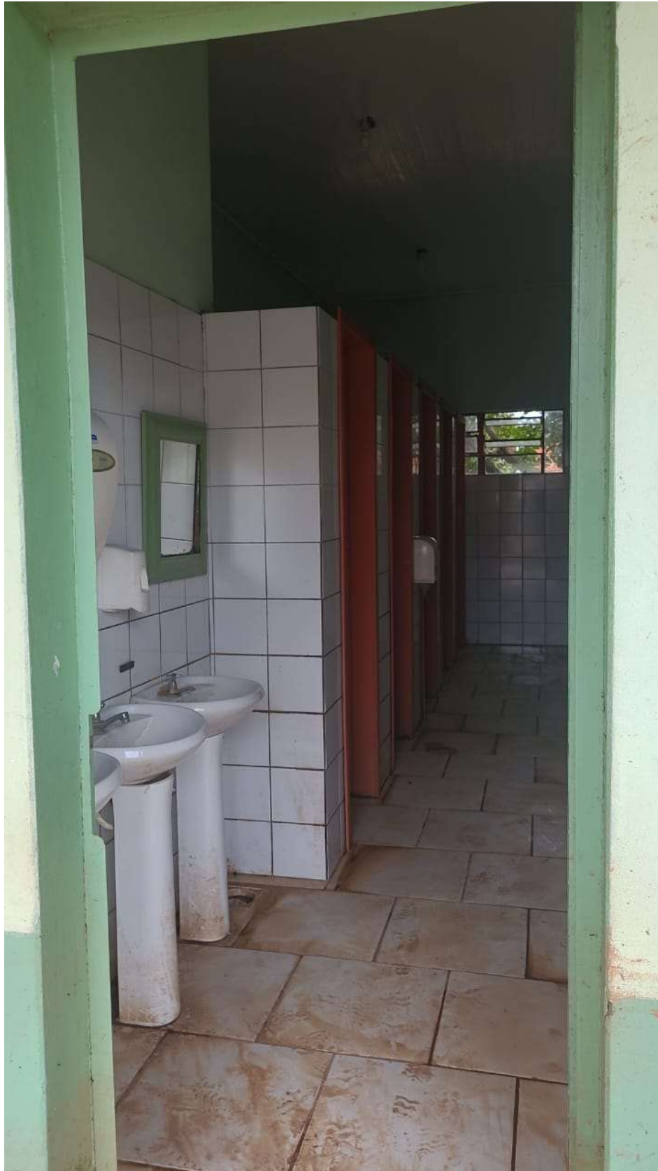
Figura 8: Louças e metais sanitários danificados

PREFEITURA MUNICIPAL DE TRIUNFO SECRETARIA MUNICIPAL DE PLANEJAMENTO E URBANISMO Rua XV de Novembro, 30 – Triunfo – RS – CEP – 95.840-000 e-mail: planejamento@triunfo.rs.gov.br