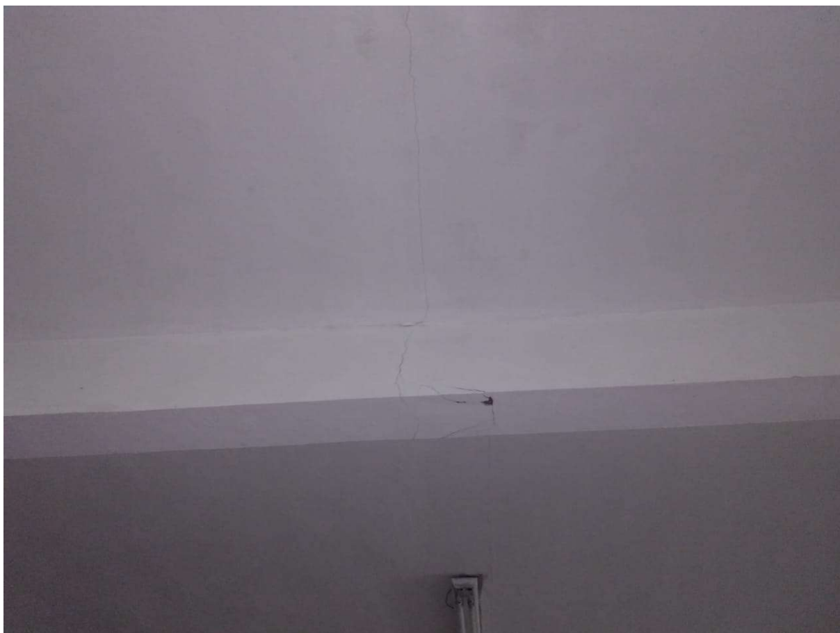
Figura 1: Trincas na viga interna da edificação

Diante da existência de uma fissura vertical na face inferior de uma viga interna do prédio anexo à Secretaria Municipal de Educação (ilustrado na imagem abaixo), faz-se necessário o reforço estrutural do elemento para resistir aos esforços solicitantes.