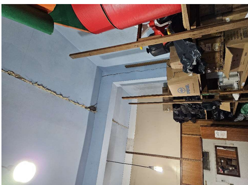
Figura 3: Separação entre etapas da edificação - 02